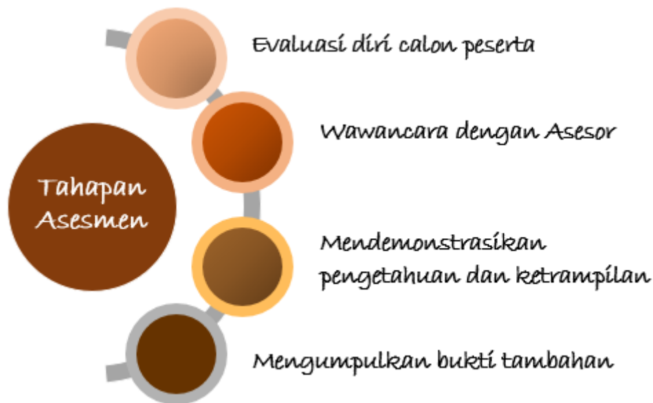
Gambar 1: Tahapan Asesmen RPL

Dokumen-dokumen portofolio ( Bukti ) untuk mendukung klaim calon atas pernyataan kriteria capaian pembelajaran mata kuliah atau modul pembelajaran yang dilampirkan calon pada saat mengajukan lamaran akan diverifikasi dan divalidasi oleh Asesor sesuai prinsip bukti, yaitu, sah, cukup, terkini dan otentik.